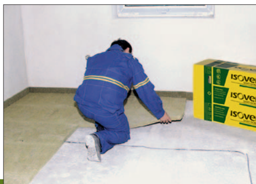
Ukázka aplikace výrobku ISOVER T-N

7) FU = funkční jednotka (1 m 2 izolace o tloušťce 25 mm při započítaných fázích životního cyklu A1-A3).