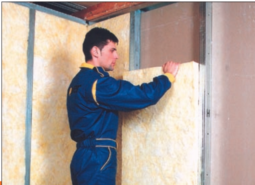
Die Beispielapplikation des Isover PIANO