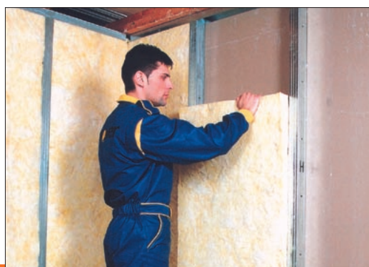
Ukázka aplikace výrobku Isover PIANO