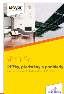
Detailní popis aplikace výrobku je uveden v katalogu ISOVER Příčky, předstěny a podhledy.

4. 7. 2019 Uvedené informace jsou platné v době vydání technického listu. Výrobce si vyhrazuje právo tyto údaje měnit.