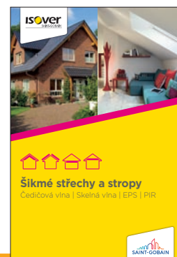
Detailní popis aplikace výrobku je uveden v katalogu ISOVER Šikmé střechy a stropy

4. 7. 2019 Uvedené informace jsou platné v době vydání technického listu. Výrobce si vyhrazuje právo tyto údaje měnit.