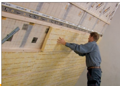
Ukázka aplikace výrobku Isover MULTIPLAT 35 NT

6) FU = funkční jednotka (1 m 2 izolace o tloušťce 100 mm při započítaných fázích životního cyklu A1-A3).