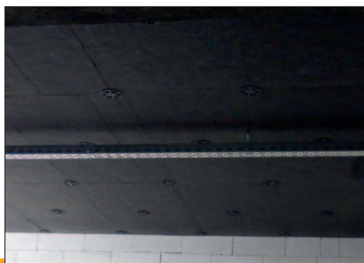
Ukázka aplikace výrobku ISOVER Fassil NT

7) FU = funkční jednotka (1 m 2 izolace o tloušťce 120 mm při započítaných fázích životního cyklu A1-A3).