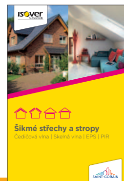
Detailní popis aplikace výrobku je uveden v katalogu ISOVER Šikmé střechy a stropy

1. 9. 2020 Uvedené informace jsou platné v době vydání technického listu. Výrobce si vyhrazuje právo tyto údaje měnit.