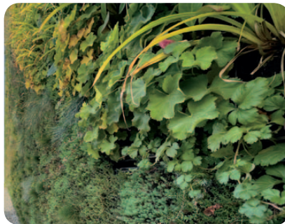
ZELENÁ STĚNA EXTENZIVNÍ Festuca, Sedum, Thymus