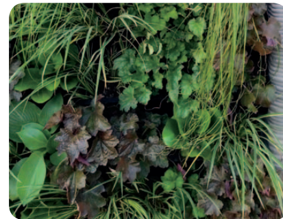
ZELENÁ STĚNA INTENZIVNÍ Geranium, Heuchera, Mentha