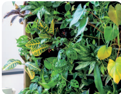
ZELENÁ STĚNA VNITŘNÍ Philodendron, Scindapsus, Chamaedorea

zeleně a vodního hospodářství do zastavěných oblastí. Vrací zeleň tam, kde bychom ji už nečekali. Významně zlepšují kvalitu vzduchu. Ochlazují a zvlhčují vzduch a odebírají z něj škodliviny. Zelené fasády skrývají mnohem více než jen barevnou variaci fasády.