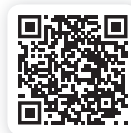
Isover Vario ® XtraPatch