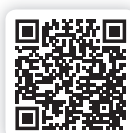
Isover Tram MW