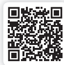
Isover Vario ® MultiTape SL+