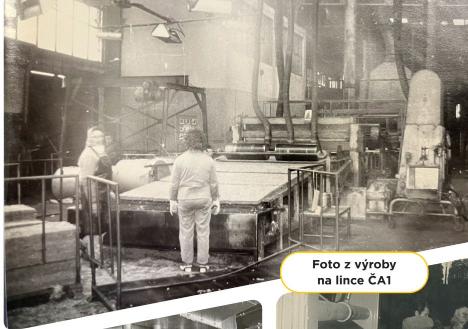
Foto z výroby na lince ČA1