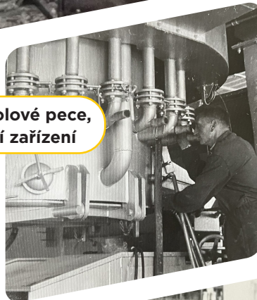
Spodní část kupolové pece, a rozvláknovací zařízení