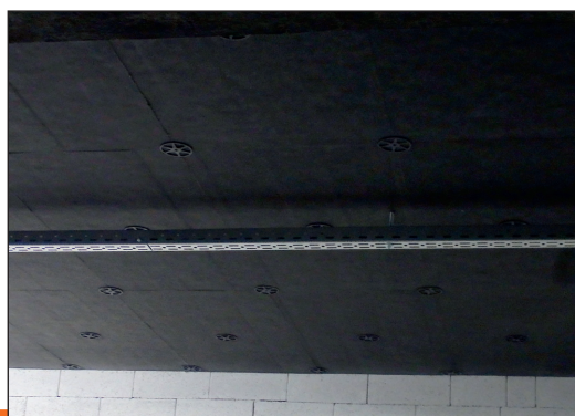
Ukázka aplikace výrobku ISOVER Akustic SSP 2

9) Informativní nedeklarovaná hodnota nad rámec CPR, získaná konkrétními zkouškami.